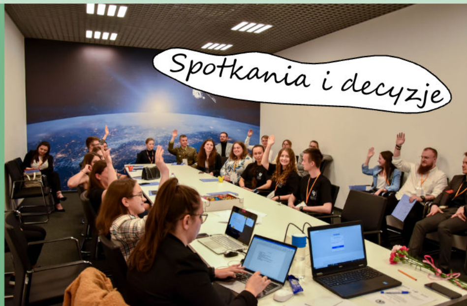
Spotkania i decyzje